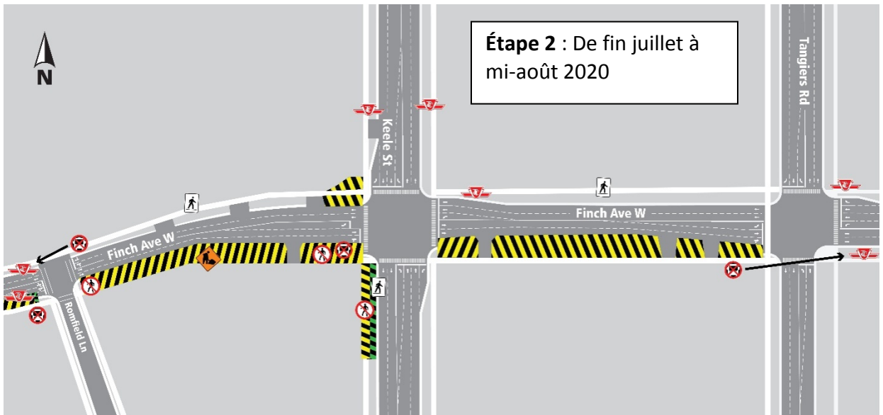
TLR de Finch West