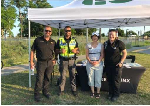
Nous avons fait équipe avec VIA Rail pour animer un kiosque d'information sur la sécurité.