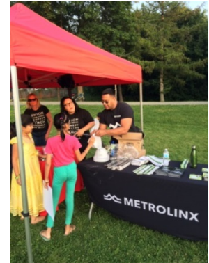
Les équipes de Crosstown et du programme d'expansion

Notre équipe a activement mobilisé les communautés dans les zones de projet durant le trimestre.