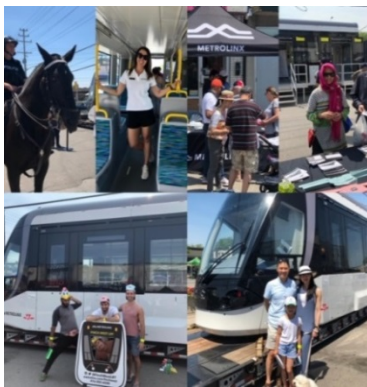
L'équipe du TLR de Finch West présente la maquette du véhicule Alstom à la communauté.

• Au cours de l'été, l'équipe des relations communautaires de Toronto-Ouest a sensibilisé plus de 600 personnes lors de divers événements, dont le Duke Eats Festival, le Fusion of Taste Festival, Tastes and Sounds of Jane and Finch et le Black Creek Farm Festival. Des kiosques d'information ont été installés au centre commercial York Gate, au carrefour communautaire Rexdale, au centre commercial Jane-Finch, à la bibliothèque York Woods et à la bibliothèque Albion. En juillet, l'équipe a également fait une présentation sur le transport en commun au centre d'hébergement Norfinch Care Community.