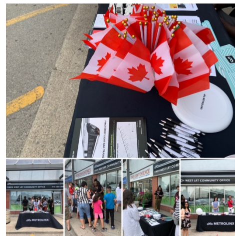
Metrolinx était bien représentée à ce kiosque d'information lors de la fête du Canada.

d'intérêt de Metrolinx sur les droits de dénomination de ses actifs, propriétés et services.