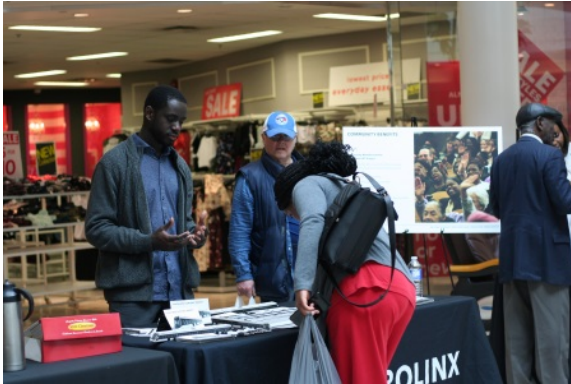
Kiosque d'information du TLR de Finch West