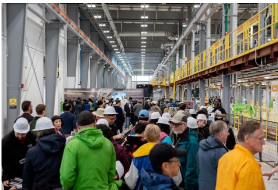
Portes ouvertes de Toronto à l'installation de maintenance et de remisage d'Eglinton Crosstown.

importantes au cours du dernier trimestre. Un total de 112 articles originaux ont été publiés au cours de la période concernée et plus de 40 000 consultations ont été enregistrées en mai 2019. Ceci représente une augmentation de 64 % par rapport aux 24 299 consultations de février.