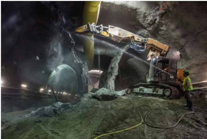
Un regard en coulisse sur le creusement d'un tunnel se déroulant sous la gare d'Avenue du Crosstown.