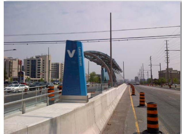
Gare VIVA Leslie