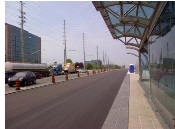
Pavage de la voie rapide