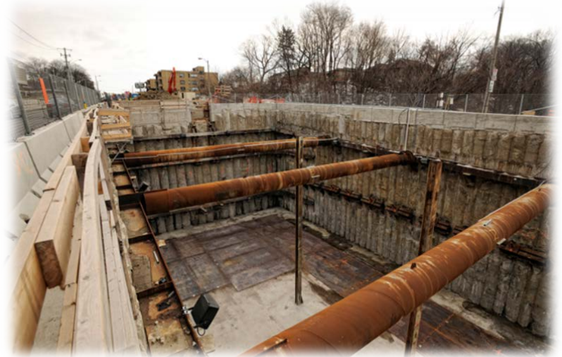
Puit de lancement ouest