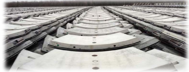
Revêtements de tunnel