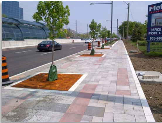
Paysage de rue le long de l'autoroute 7