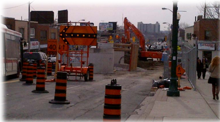
Gestion de la circulation pour les murs de tête de Keele